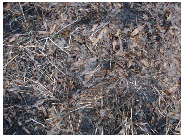
Bladfald fra pil